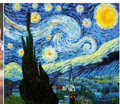
Vincent Van Gogh. La nuit étoilée, 1889. Musée d'Art Moderne, New York.