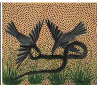
©Piliplili Mulongoy, Sans titre, 1955 Gouache et huile sur papier.