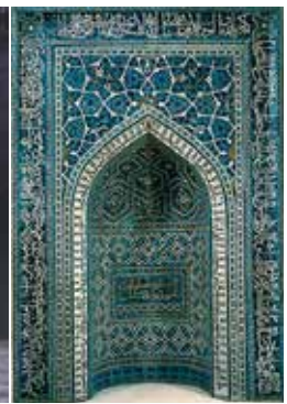
Mirhab en céramique.