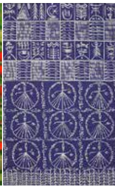
©Rachid Koraïchi. Rumi Lithographie de la série Rumi.