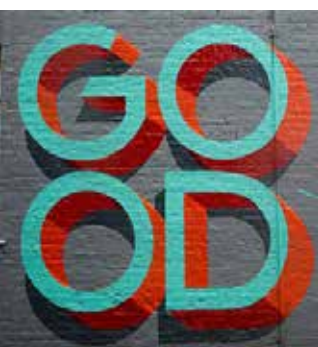
Street art, artiste inconnu

Le soufisme a une approche universelle des arts, qui ne se limite pas au seul champ culturel du monde arabe ou musulman. Cette approche vise à élargir l'horizon de la conscience humaine. Ainsi, la pratique soufie peut conduire à goûter autrement la musique classique occidentale, les arts primitifs, etc.