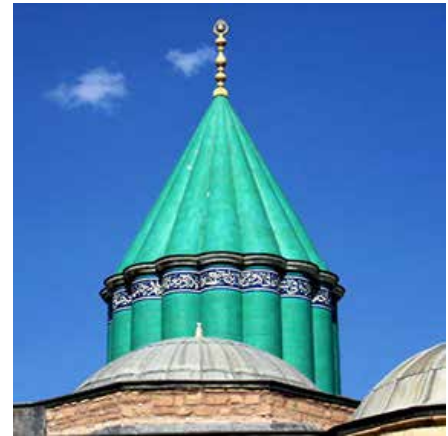
Mausolée de Rumi, à Konya (Turquie)

Ouvrir la conscience de l'homme, c'est aussi lui permettre de connaître d'autres lieux, liés à d'autres ambiances spirituelles, et de se ressourcer. Des voyages thématiques et des pèlerinages sont donc organisés aux lieux saints de l'islam, du soufisme et des spiritualités du monde, ainsi que des retraites dans le désert ou d'autres lieux inspirants.