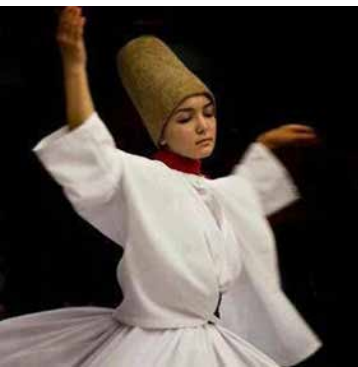
Danse sacrée de derviche tourneur.

Dans le monde musulman, il existe de nombreuses pratiques artistiques et artisanales ayant une portée spirituelle : cela concerne tout autant les arts traditionnels (chant soufi ou samâ', danse derviche, calligraphie, miniature, céramique...) que leurs expressions contemporaines (arts plastiques, arts appliqués, musique...). Offrons-les à un large public et soutenons la créativité, ici et maintenant.