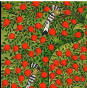
©Madina Saidova L'Arbre de vie. Aquarelle naturelle, or sur papier de soie.