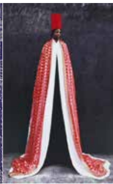
Rhokaya, 2010. From the series Giants.